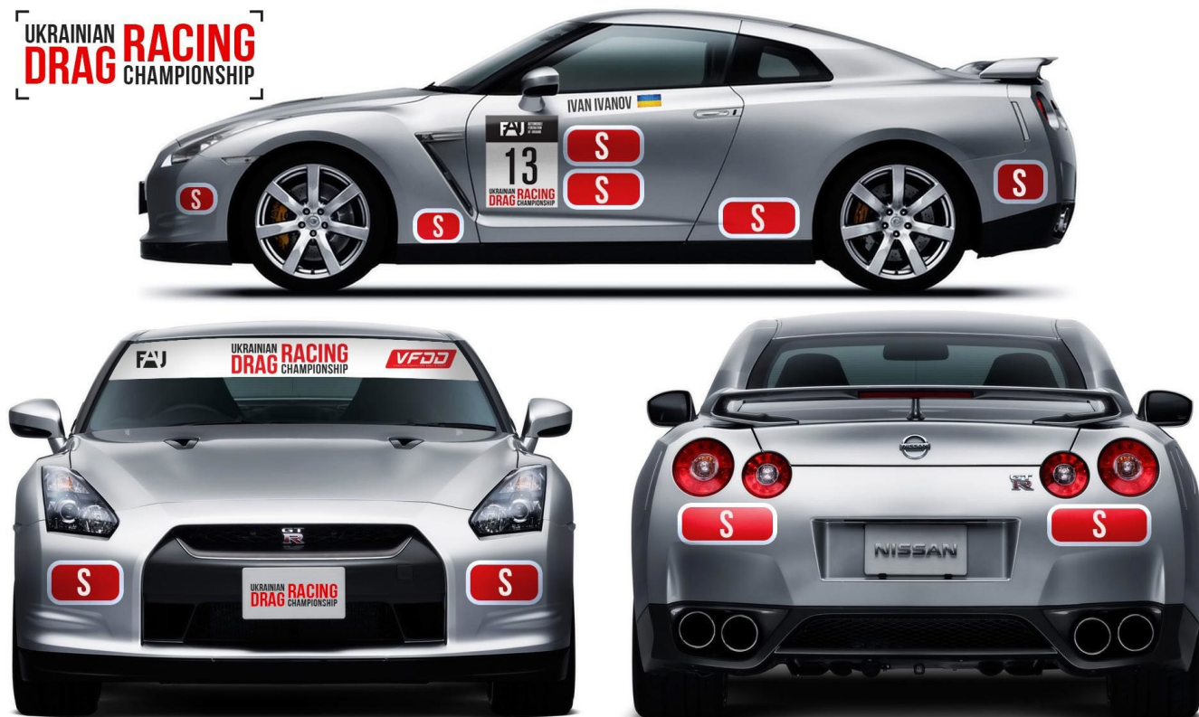
Наклейка на лобовое стекло

За порушення цієї вимоги Представник пеналізується грошовим Пеналізаціям, розмір якого повинен бути вказаний в Індивідуальному Регламенті змагання. Але такий Пеналізація не може перевищувати розмір Заявочного внеску до відповідного класу (у випадку, коли заявочні внески відсутні – відповідно до стандартного внеску), у якому допущено даний автомобіль.